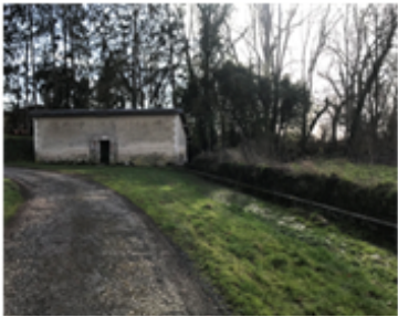
Le muret du lavoir avant les travaux...