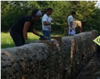
Quelques bénévoles en action

Ils étaient envoyés par le centre des « Apprentis d'Auteuil » de Lisieux, via l'Association Remparts, spécialisée dans les chantiers de restauration du petit patrimoine, avec laquelle Madame la Maire avait mis notre association en contact.