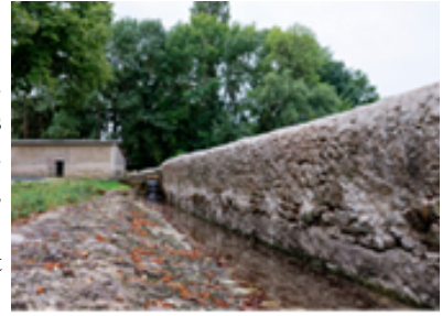
Et après !

Outre des habitants de Luché et Clion, trois jeunes bénévoles sont venus nous aider. Ce sont trois jeunes réfugiés afghans âgés de 18, 17 et 15 ans. Ils ont été hébergés chez l'habitant pendant la durée du chantier.